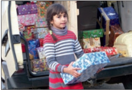
BMO Hilfsaktion zu Weihnachten