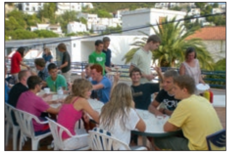
Christliche Reisen gGmbH (CRG)

1997 wurde die Stiftung errichtet. Ihr Zweck ist es, evangelistische, unterwei-