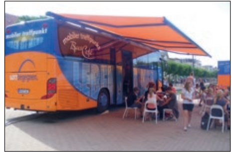
Barmer Zeltmission, das „Leben ist mehr“ Bus-Café