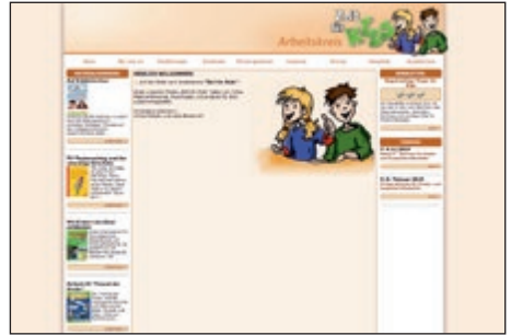
Arbeitskreis Zeit für Kids, www.zeit-fuer-kids.de