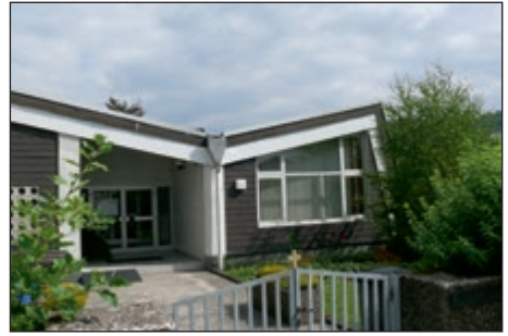
Gemeinden, die ihre Finanzen über Mission und Diakonie verwalten

Der Verein für Mission und Diakonie e.V. versteht sich als Dienstleister für Versammlungen und Gemeinden, die darauf