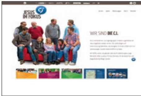
Christliche Jugendpflege, www.cj-info.de

Materialdatenbank für Teen- und Jugendmitarbeiter und informiert darüber hinaus über alles, was Mitarbeiter wissen müssen. Monatlich erscheint der Material-Newsletter cj-lernen.de und stellt neue Materialien für die Jugendarbeit vor. Ergänzt wird dieser durch den 14-tägig erscheinenden cj-info-Newsletter , der über aktuelle Termine, Freizeiten, Events und Ideen informiert.