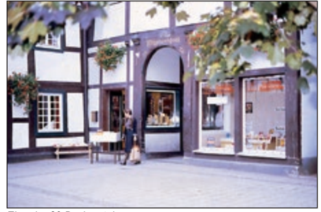
Eine der 30 Bücherstuben

und Dienst am Menschen verstanden. Ziele der Bemühungen sind die Vermittlung biblischer Werte, verbunden mit zeitkritischen Analysen, sowie die Verbreitung des Evangeliums.